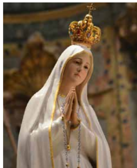
Figura Matki Boskiej z Fatimy.