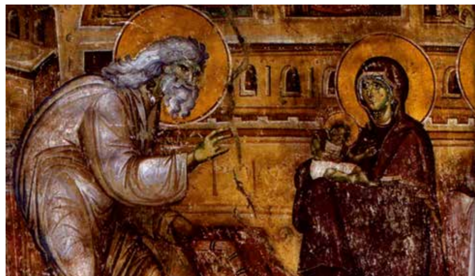
Spotkanie Symeona z Jezusem i Marią