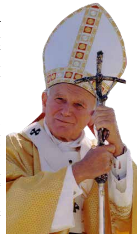
św. Jan Paweł II